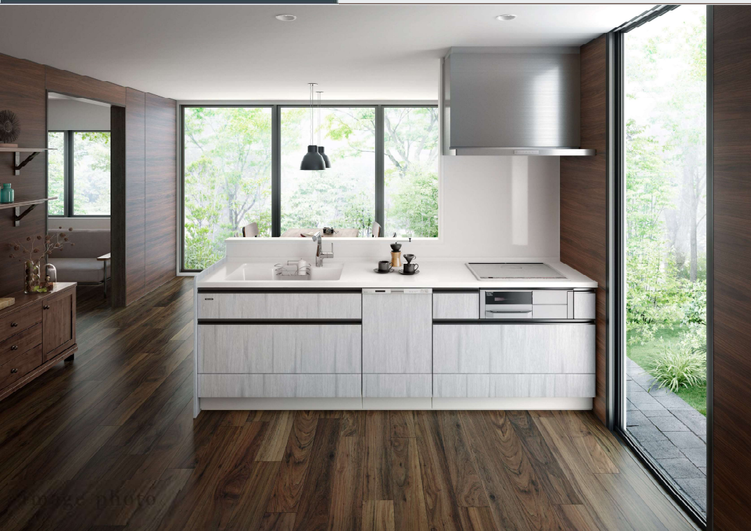
I型プラン W=2550mm×D=650mm×H=850mm 【シンクC48:食洗シンク横N】