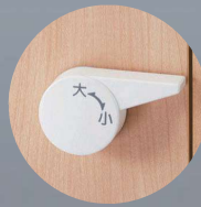
ハンドル便器洗浄